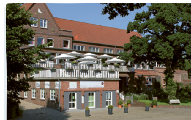
Das Hotel zur Treene in Schwabstedt blickt auf eine lange Familientradition zurück und bietet gemütliche Doppelzimmer, die auch als Einzelzimmer vermietet werden. Im Restaurant werden saisonale und regionale Gerichte der gehobenen Klasse angeboten.

Weitere Infos und Reisetermin 2026 unter www.urlaubplus.sh