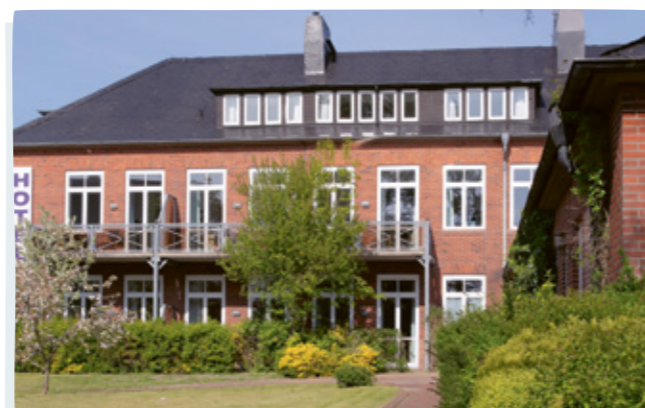
Das BEBIO-Hotel be active ist der perfekte Ausgangspunkt für Radtouren auf der Halbinsel Eiderstedt. Hier treffen Natur und Kultur aufeinander. Entdecken Sie schützende Deiche, urige Dörfer, Haubarge und 18 Kirchen.

Weitere Infos und Termin 2026 unter www.urlaubplus.sh